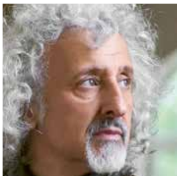
Mischa Maisky Violoncello