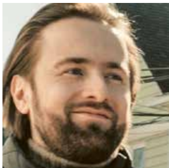
Daniil Trifonov Klavier