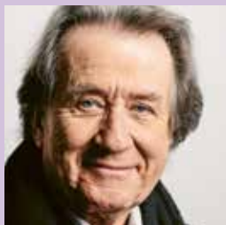
Rudolf Buchbinder Klavier

Ludwig van Beethoven (1770 – 1827) Klaviersonate Nr. 3 in C-Dur, op. 2/3 | 27'