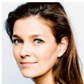
Janine Jansen Violine