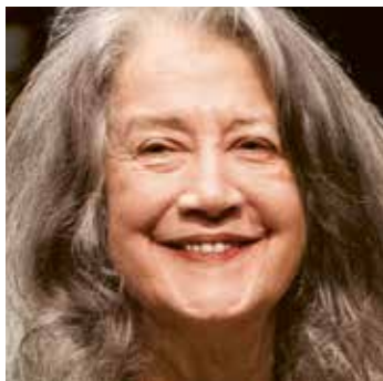
Martha Argerich Klavier