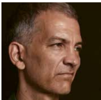
Brad Mehldau Klavier