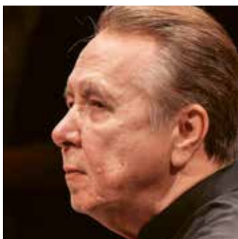
Mikhail Pletnev Klavier & Dirigent