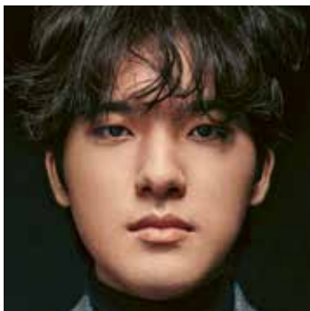
Yunchan Lim Klavier