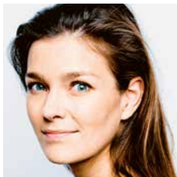
Janine Jansen Violine