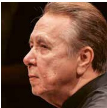
Mikhail Pletnev Klavier & Dirigent