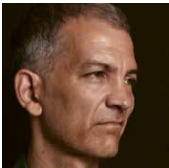
Brad Mehldau Klavier